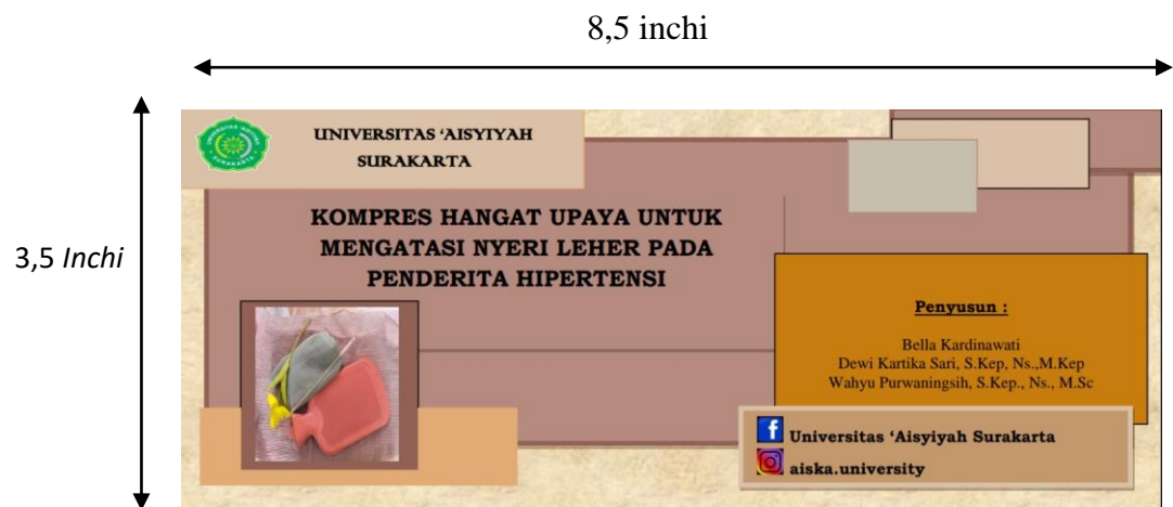
Gambar 3.1. Desain layout untuk cover