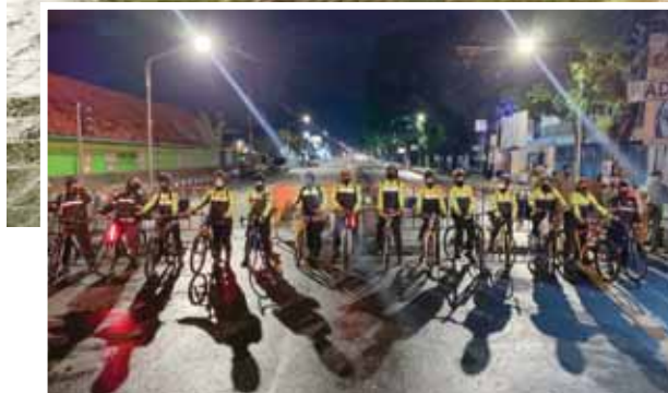
Dara Lawu Polres Karanganyar menjaga Jl. Lawu Karanganyar dengan mengendarai sepeda angin. Mereka juga menyosialisasikan 3M dan protokol pencegahan Covid-19 saat malam Tahun Baru, Kamis (31/12/2020).