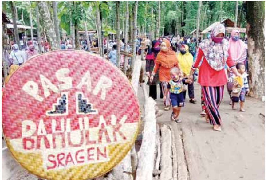
Pintu masuk Pasar Bahulak, Desa Karungan, Kecamatan Plupuh, Sragen, Jumat (1/1/2021)

Meski kerumunan pengunjung sulit dihindarkan, namun Pemdes Karungan berupaya keras menerapkan protokol kesehatan. Mereka menyiapkan 13 keran air dan 25 gentong kecil atau padasan sebagai sarana cuci tangan. Mereka juga melakukan penyemprotan lokasi dengan disinfektan sebelum dan