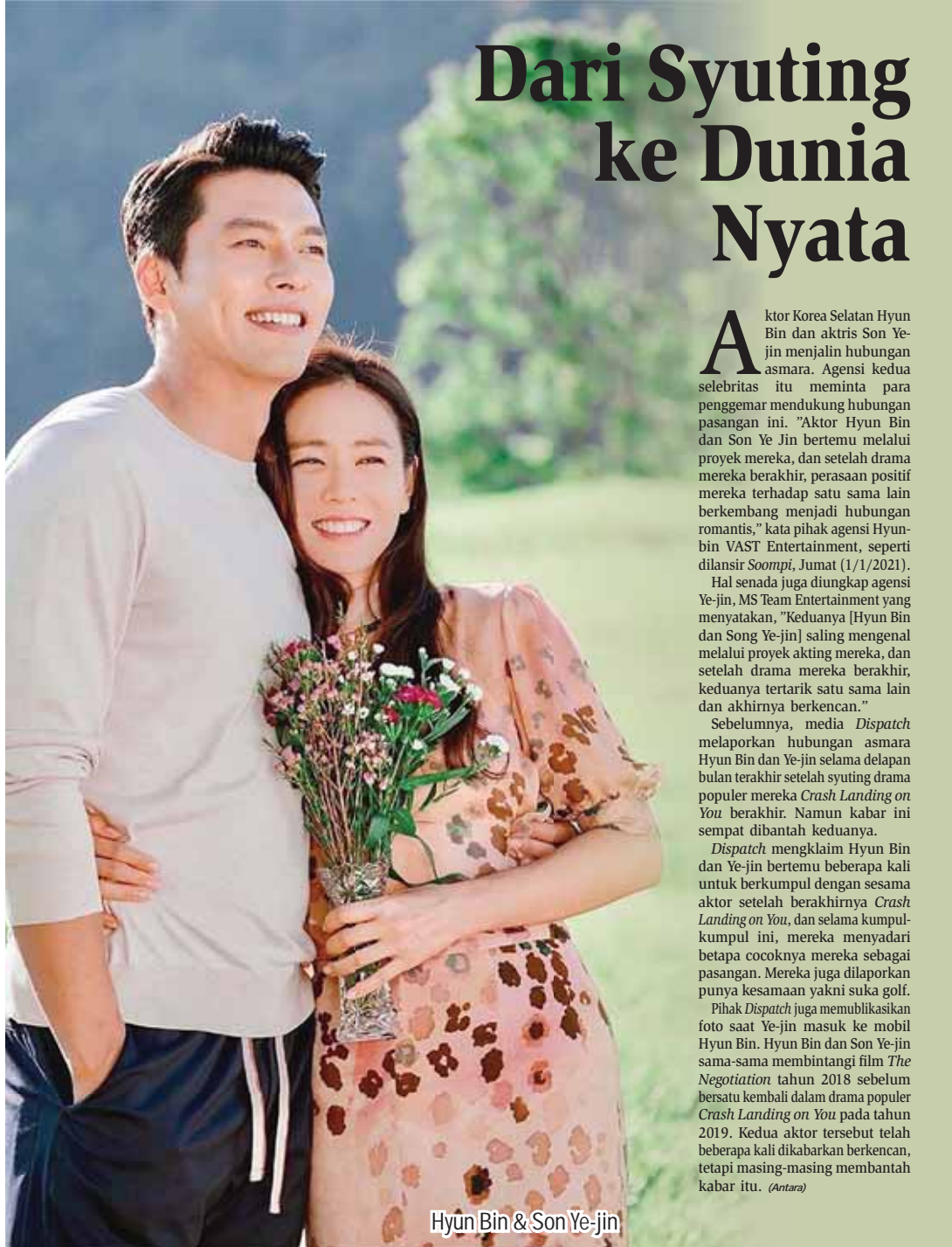
Hyun Bin &amp; Son Ye-jin