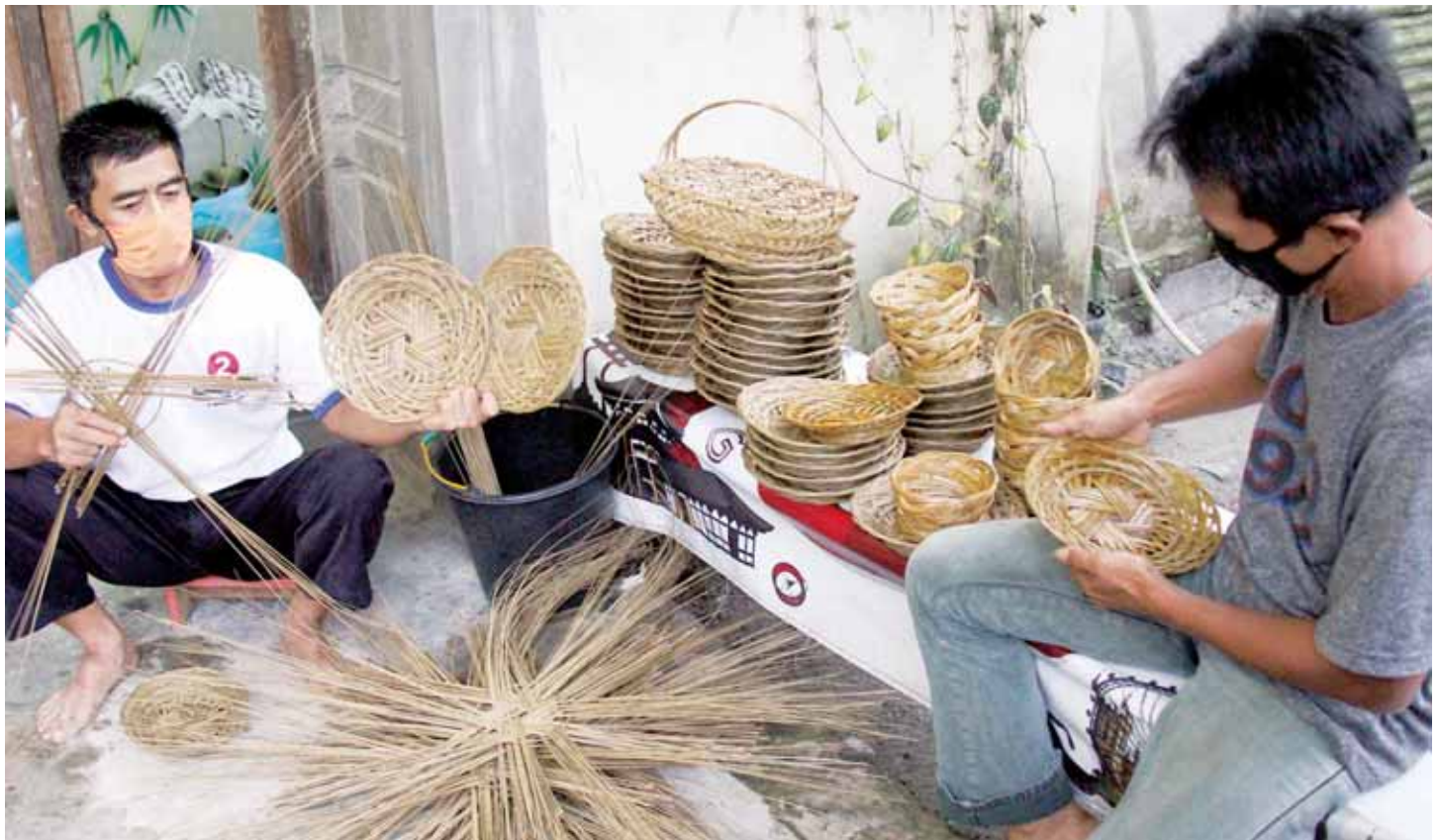
LIDI SAWIT: Sejumlah pengrajin membuat piring dari bahan lidi sawit di Desa Kampung Baru Bukit Kapur Dumai, Riau, Rabu (30/12/2020). Selain membuat piring dari bahan lidi sawit perajin tersebut juga membuat sarang lampu hias, talam, tempat air mineral, sendok dan tisu yang dijual seharga Rp6.000 hingga Rp120.000 per buah.

"Selain itu Covid-19 yang belum tertanggulangi ini juga terjadi di daerah-daerah luar Jawa. Kenaikan kasus ini tentu mengurungkan niat belanja masyarakat," kata Roy. ( Bisnis )