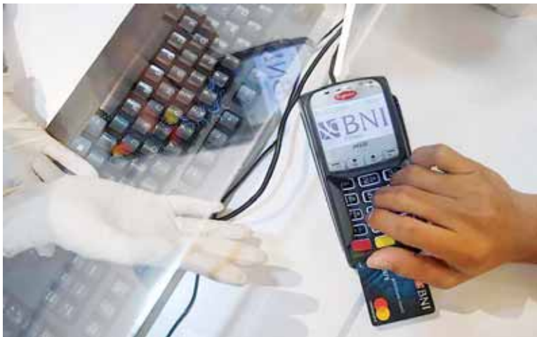
Petugas customer service melayani nasabah di Kantor Cabang BNI Mega Kuningan, Jakarta, Kamis (31/12/2020). Selama masa liburan Natal dan tahun baru BNI tetap mengoperasikan secara terbatas 201 outlet di seluruh Indonesia dengan tetap menerapkan protokol kesehatan.