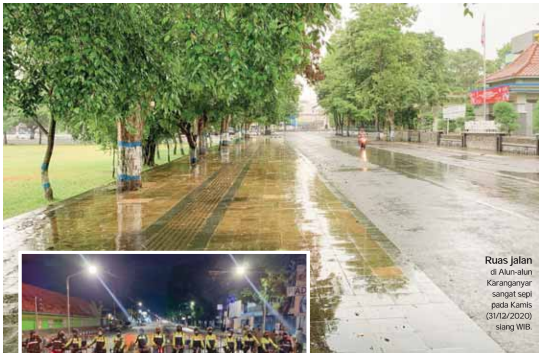
Ruas jalan di Alun-alun Karanganyar sangat sepi pada Kamis (31/12/2020) siang WIB.

Dengan semikian Puskesmas Nargoyoso sudah dua kali ditutup khusus untuk layanan rawat inap dan IGD. Kali pertama ditutup pada September 2020 lantaran 10 tenaga kesehatan di tempat tersebut melayani pasien yang terpapar Covid-19.