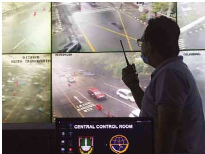
Petugas Dinas Perhubungan (Dishub) Kota Solo memantau arus lalu lintas dari layar monitor kamera closed circuit television (CCTV) di Central Control (CC) Room Dishub Kota Solo, Jumat (1/1/2021). Menurut data dari Dishub Kota Solo volume kendaraan yang masuk dan keluar Kota Solo selama libur Natal 2020 dan Tahun Baru 2021 mengalami penurunan dibandingkan dengan libur Nataru tahun sebelumnya. Berita di bagian lain halaman ini.

"Jalan rawan macet dan padat lalu lintas pada tahun lalu di kawasan Klodran, Kleco, sekitar Dawung, dan Ringroad. Pantauan sekarang enggak. Pasar Nangka saja tetap padat," kata dia, kemarin. (yup)