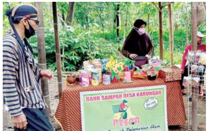
Bank Sampah Peduli Sampah Pelestari Alam (Pespa) Desa Karungan menjajakan produk kerajinan daur ulang di salah satu stan Pasar Bahulak, Karungan, Plupuh, Sragen, Jumat (1/1/2021).