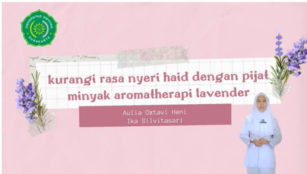
Gambar 4.1 Cover Luanan