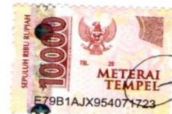
IMELDA NIM 2023222