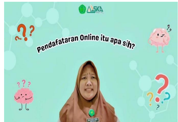
Gambar Awal Video