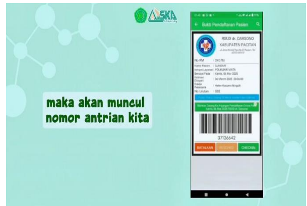
Gambar Isi Materi Video