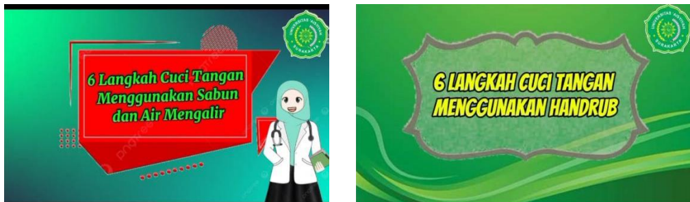
Gambar Bagian Pertengahan Video