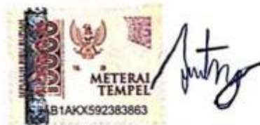
Aditya Nur Wahyudi E201901