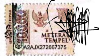
Faizah Nurul Fitri