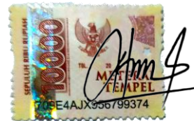
Elsa Nur Pratiwi