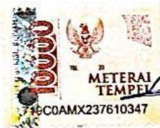
Harrys Purwanda E2019022