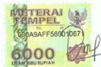
Desy Widiyanti NIM E2015008