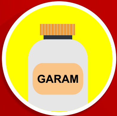
Asupan garam berlebih